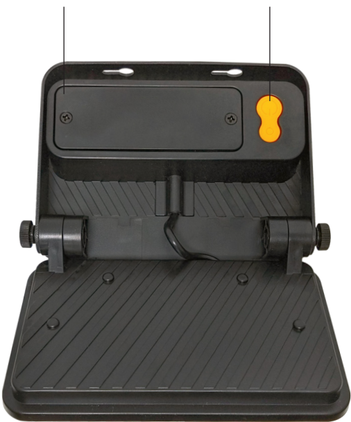
unabhängig von traditionellen Energiequellen